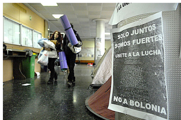
Estudiants acampats a la facultat d'Història. ADN

Per tal de que els actes siguin més conjunts a tot l'estat les assemblees han establert vincles de comunicació més estrets i van demanar a la societat que s'implique en la reivindicació perquè el que es pretén és "defendre una necessitat social, com és l'educació". D.F.