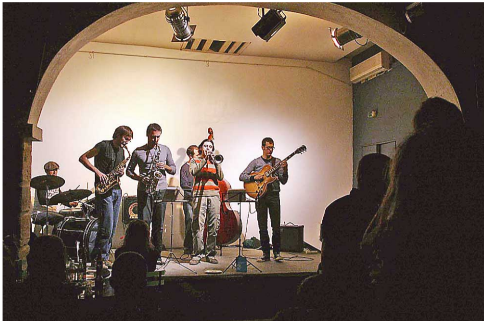
Un momento de la actuación en Ca Revolta, en la presentación de la asociación en Valencia.

Todo esto y mucho más quieren los nuevos componentes de la recién creada asociación de Artistas visuales de València, Alacant i Castelló, AVVAC, sin ánimo de lucro. Hasta ahora la Comunitat no tenía un foro similar desde el que hacerse oír en otros ámbitos estatales o locales, y el grupo formado ahora pretende subsanar ese vacío: opinar, aconsejar o recalcar sobre asuntos que les conciernen, colaborar de forma legal en cualquier otra asociación, promover el arte contemporáneo en nuestro territorio, trabajar para dignificar al artista como productor de conocimiento, mejorar la situación fiscal, negociar ventajas y descuentos profesionales. Todo un reto.